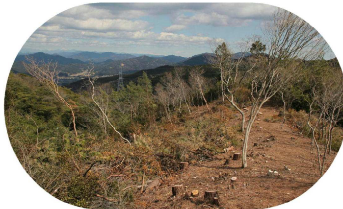
本丸東の尾根 遠くに富士山も