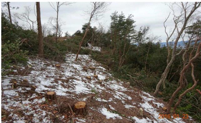
雪が残る寒い日でした