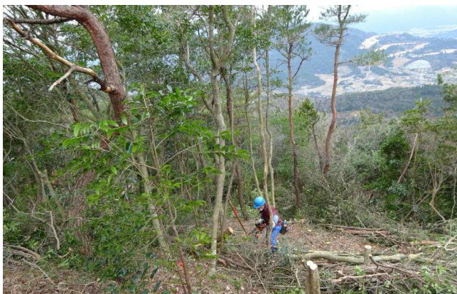
本丸近くの北側斜面