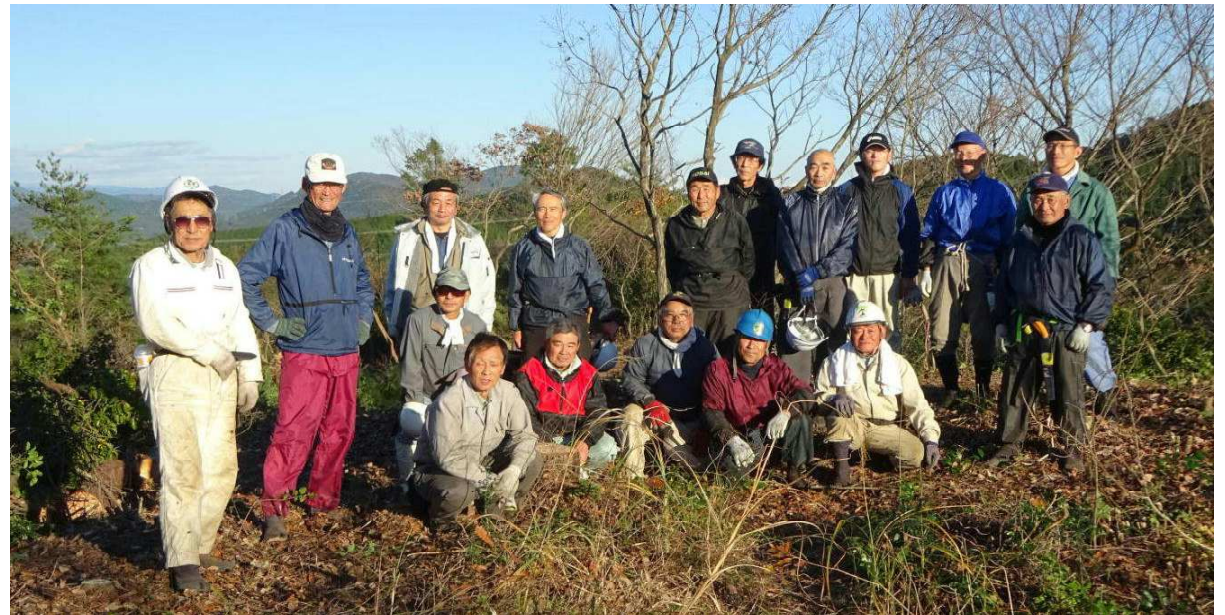
富岡まちづくり協議会のボランティアの方々と共に