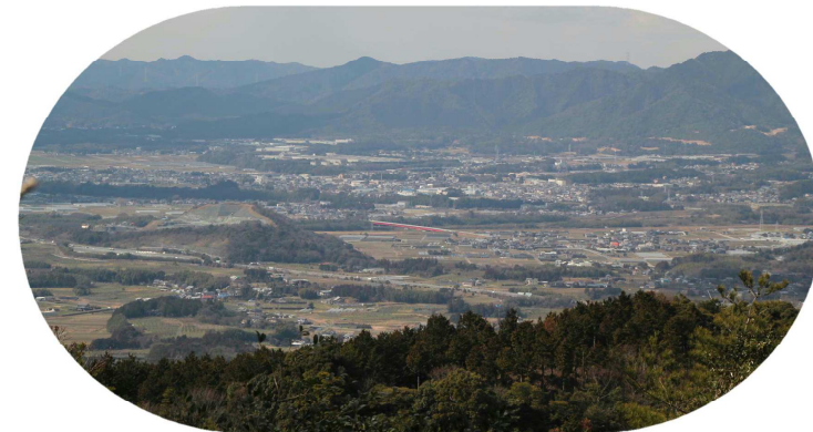
豊川市方面も見渡せるように