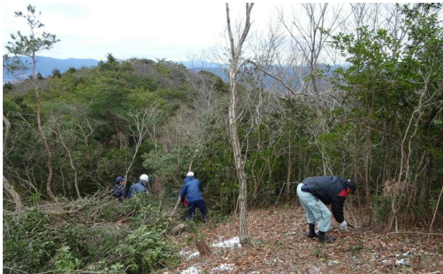
出丸への小道を整備