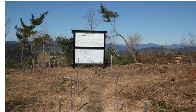
眺望が開けた本丸 新たな説明板も