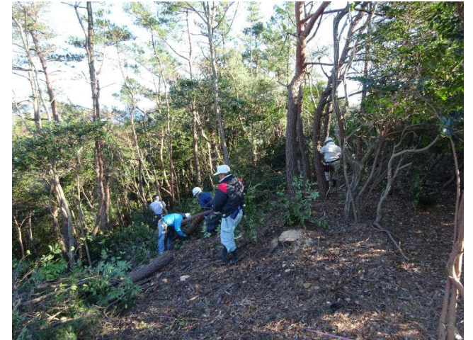
出丸への降り口付近